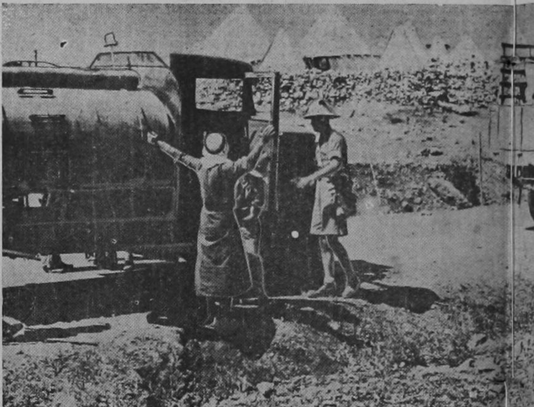
Estos soldados ingleses que recorren Tierra Santa, teatro de la lucha entre árabes y judíos por la tienen a los camiones árabes a la entrada de Jericó y registran a sus ocupantes para quitarles las armas que puedan llevar ocultas

LOS SOLDADOS BRITANICOS EN LA GUERRA DE PALESTINA