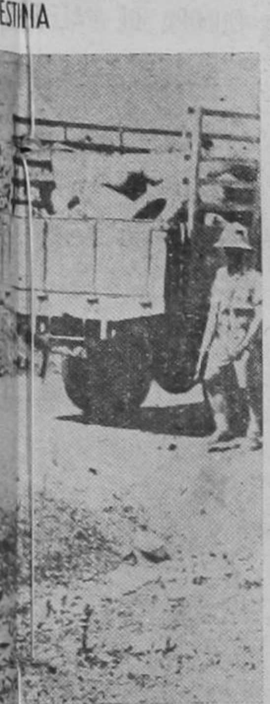
por la posesión de Palestina, de...

Como es natural, la noticia tiene que ser muy bien recibida en Limón, que será el centro de las actividades, por lo que esto viene a intensificar el movimiento agrícola y comercial de aquella región, que por cierto bastante lo necesita.